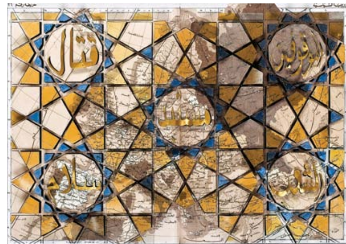
EUROPEAN SPRING, 86.5 x 111 CM / ITALIAN SPRING, 147 x 111 CM – CHALK, ACRYLIC AND CUT OUTS ON PAPER, 2012

AMONG THE MAIN GROUP EXHIBITIONS WE CAN MENTION IN 2011 ITALIAN GENIUS NOW. HOME SWEET HOME , KAOSHIUNG MUSEUM OF FINE ARTS, TAIWAN, TW; WHEN IN ROME , ITALIAN CULTURAL INSTITUTE, LOS ANGELES, US; UN'ITA ITALIAN ARTISTS IN NEW YORK, INDUSTRIA GALLERY, NEW YORK, US; IN 2009 SLASH, PAPER UNDER THE KNIFE , MAD MUSEUM OF ART AND DESIGN, NEW YORK, US; IN 2008 1988, VENT'ANNI PRIMA VENT'ANNI DOPO , MUSEO D'ARTE CONTEMPORANEA PECCI, PRATO, IT; APOCALITTICI E INTEGRATI , MAXXI, ROME, IT; IN 2005 RESIDENTI , FONDAZIONE PASTIFICIO CERERE, ROME, IT; FRAGMENTS OF TIME , YELLOW BIRD GALLERY, NEW YORK, US; IN 2004 OTTO MONACHE NIGRE , TODI, IT; PREMIUM+ , POSTDAMERPLATZ, BERLIN, DE; IN 2001 DUETTO ALL'ITALIANA , YOUNG ARTISTS SELECTED BY GALLERIA NAZIONALE D'ARTE MODERNA, SENDAI, JP.